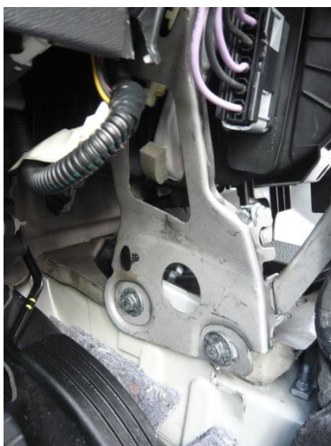
Pièce de renfort sous la planche de bord